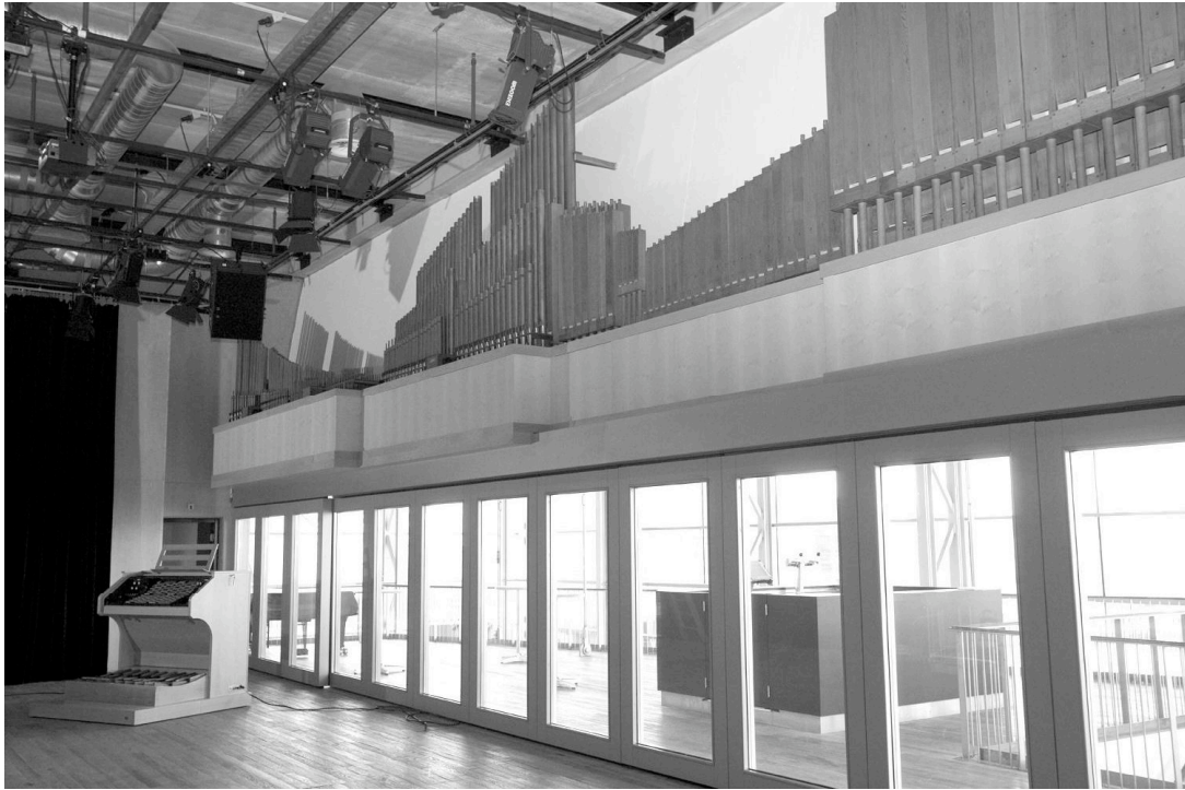
The newly restored Fokker organ in its new location in the BAM-Zaal of the Muziekgebouw aan t'IJ, Amsterdam (above); and a close-up of its keyboard (below).